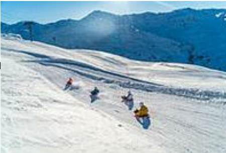
Piste de luge Roc'n Bob ☎ 04 79 00 62 75